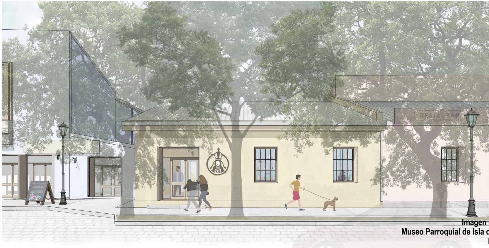
Imagen Objetivo Museo Parroquial de Isla de Maipo Dic 2021