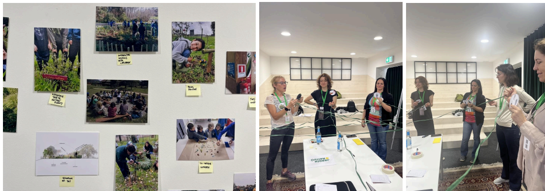
Fotos de nuestra actividad práctica "Small Native Gardens" realizada en TNOC, Berlin.