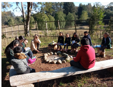
2024 Escuela Coligual, Llanquihue