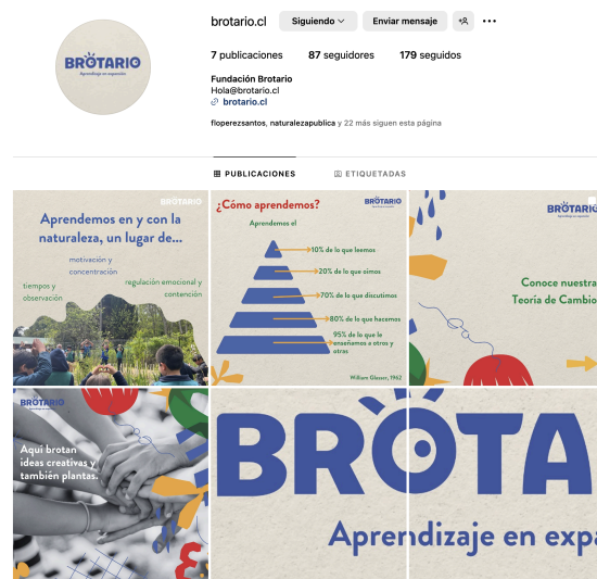
Publicaciones de la Fundación