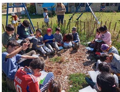
2024 Escuela Los Bajos, Frutillar

Nuestro equipo visita las 10 escuelas del programa cada semana, implementando junto a los docentes, actividades que promueven cambiar de aula, salir afuera, observar, detenerse y preguntarse asuntos relacionados a las dinámicas de la naturaleza y colaborar para encontrar respuestas.