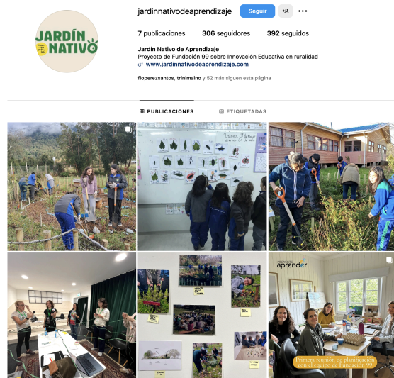
Publicaciones del Programa

Además de esto, el 2024 lanzamos una serie de 4 capítulos de podcast y publicaciones en nuestras redes sociales del programa y de la fundación .