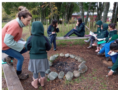
2024 Escuela Coligual, Llanquihue

Junto a lo ejecutado durante los 3 años previos, este 2024 hemos continuado la labor de trabajar habilidades para la vida por medio del trabajo en el jardín de la escuela, haciendo uso del Jardín Nativo como un aula al aire libre, siempre teniendo como objetivo central, conectar a los estudiantes con la naturaleza y promover la educación ambiental y el bienestar emocional.