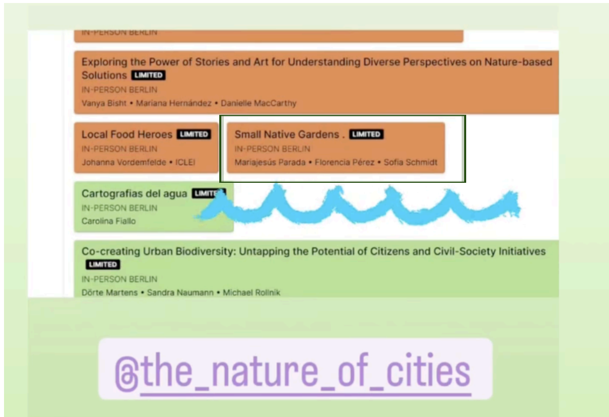
Publicación del instagram de The Nature of Cities.

En junio del 2024 participamos del The Nature of Cities Festival en Berlín, haciendo una actividad práctica para presentar nuestro programa y hablar de los niños y la naturaleza.