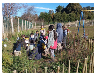
2024 Escuela Los Bajos, Llanquihue