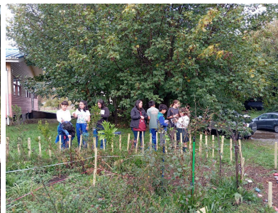
2024 Escuela Loncotoro, Llanquihue

Nuestro equipo visita las 10 escuelas del programa cada semana, implementando junto a los docentes, actividades que promueven cambiar de aula, salir afuera, observar, detenerse y preguntarse asuntos relacionados a las dinámicas de la naturaleza y colaborar para encontrar respuestas.