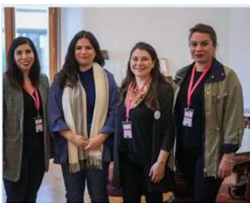
MINISTERIO DE LA MUJER

El 18 de mayo del 2023 representantes de la Fundación con reunieron con la ministra de la Mujer, Antonia Orellana en el Palacio de La Moneda. La finalidad del encuentro fue hablar sobre el parto respetado en situaciones de duelo, la Fundación Ley Dominga y la Salud Mental Perinatal.