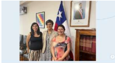
REUNION MINISTERIO DE SALUD Fundación Ley Dominga

Otro elemento esencial de “En mi corazón habitan tus latidos” es la mariposa, símbolo de la fundación. La mariposa representa la transformación que experimentamos los padres una vez que viven el duelo, también simboliza que sus hijos están volando, y cada vez que ven una mariposa, se los recordará.