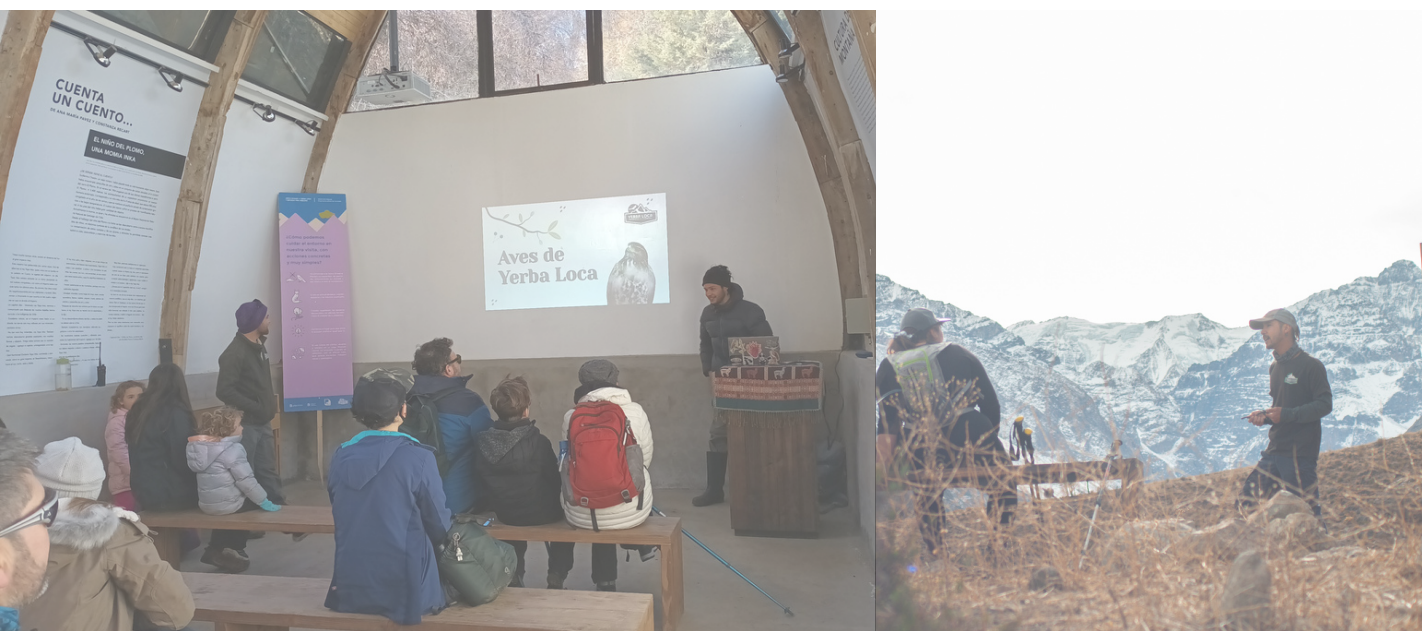
Figura 7. Fotografía de la charla de aves en el Centro de Visitantes y el guiado "Origen de las Montañas"

Desde que asumió la administración, se ha implementado un completo plan de educación ambiental en el Parque Yerba Loca. Este plan incluye senderos guiados, charlas educativas en el Centro de Visitantes e inducciones para visitantes y grupos organizados, donde se enfatizan las técnicas de "No Deje Rastro". Los senderos guiados abarcan temáticas como la flora de Yerba Loca, las aves de Yerba Loca y el fascinante recorrido nocturno "Caminando bajo los astros". Además, se ofrecen charlas informativas sobre aves de Yerba Loca, huellas de mamíferos y la importancia de los glaciares, brindando a los visitantes una experiencia enriquecedora y educativa. Todo esto se lleva a cabo con el objetivo de fomentar la conciencia ambiental y promover la conservación en este hermoso santuario natural.