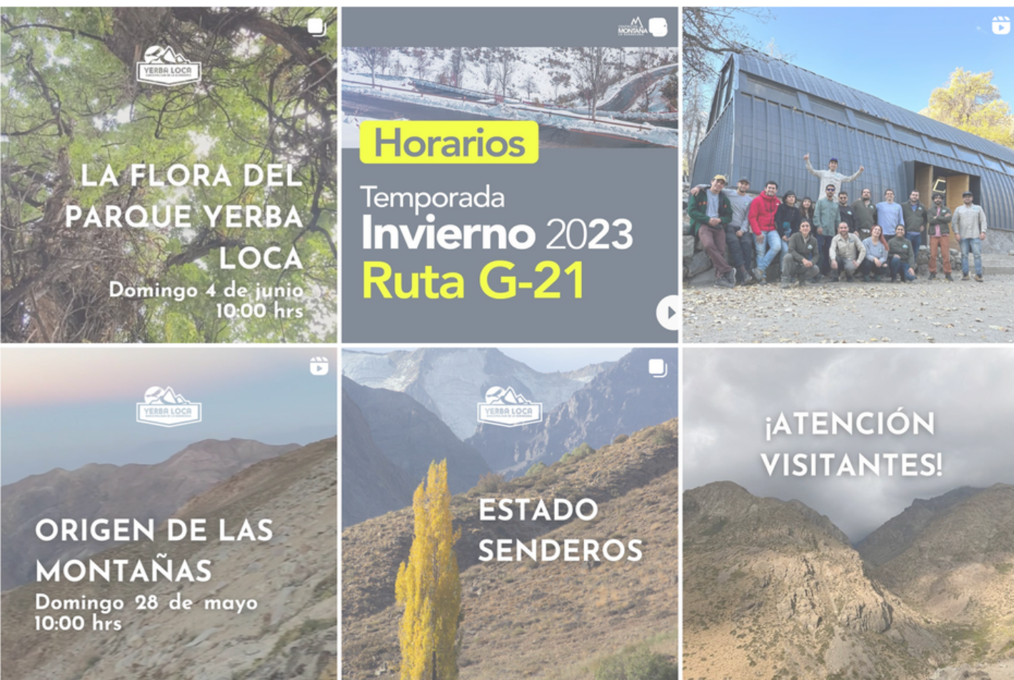
Figura 8. Fotografía del feed del Instagram de Yerba Loca

El plan de comunicaciones de la Corporación Robles de Cantillana contempla diversas acciones para garantizar una efectiva difusión y conexión con la comunidad. Entre estas acciones se encuentra la instalación de un sistema radial, que permite mejorar la fluidez de las comunicaciones entre los guardapaques durante la operación día a día. Asimismo, se desarrolló un sistema de reportes radiales entre el equipo de guardaparques, que permite recopilar información importante y generar informes periódicos sobre el estado y las novedades del santuario, asegurando una comunicación clara y transparente entre el equipo. Además, se trabaja en el fortalecimiento de la presencia en redes sociales, utilizando plataformas digitales para difundir contenido relevante, promover la participación de la comunidad y mantener una comunicación constante. Estas iniciativas en el ámbito de las comunicaciones son fundamentales para ampliar el alcance y la visibilidad de las actividades de conservación y así promover la participación activa de la comunidad en la protección del patrimonio natural.