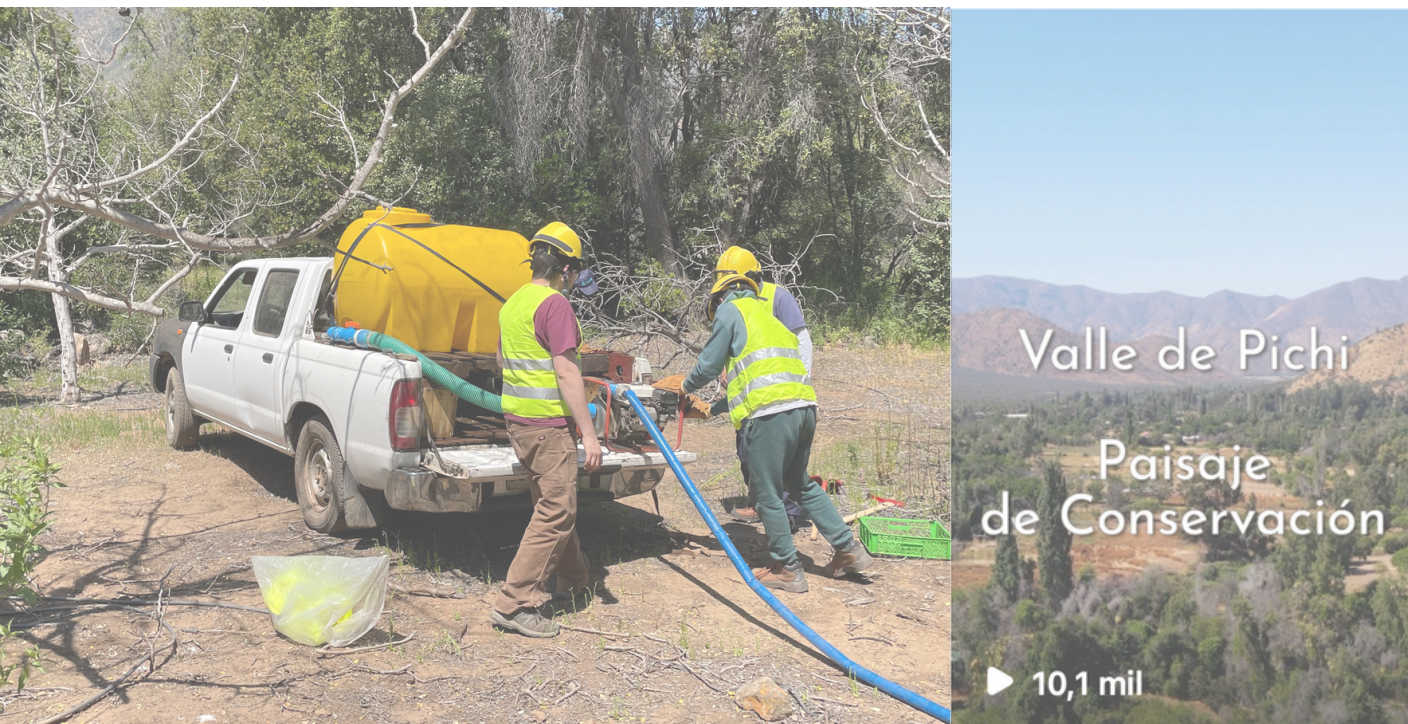
Figura 6. Fotografía de la camioneta aljibe y de la portada del video campaña de Barrancas de Pichi

La participación activa de la ciudadanía en asuntos ambientales ha sido promovida a través de diversas instancias colaborativas. Se destaca el rol de la Corporación Robles de Cantillana en el Comité Ambiental Comunal de Alhué, donde ha trabajado en conjunto con la comunidad. Además, en una muestra de unidad, se llevó a cabo una campaña en colaboración con los residentes de Barrancas de Pichi para evitar la instalación de una extensa área de paneles solares en la localidad, la cual no estaba en línea con los deseos de preservar el entorno natural sin intervenciones. Como resultado de este esfuerzo, la corporación produjo un video viral que se difundió en las redes sociales, destacando los valores ambientales de Alhué y presentando testimonios de los habitantes de Pichi, quienes expresaron su preocupación por el proyecto. Además, en una consulta ciudadana en colaboración con la junta de vecinos se registró un rechazo del 99% de los residentes de Pichi hacia la instalación de los paneles solares. Estos resultados disuadieron a los responsables del proyecto y se decidió no llevar a cabo la instalación. Este trabajo conjunto demuestra el poder de la participación ciudadana y la importancia de la preservación de los deseos y necesidades de la comunidad en decisiones que afectan su entorno.