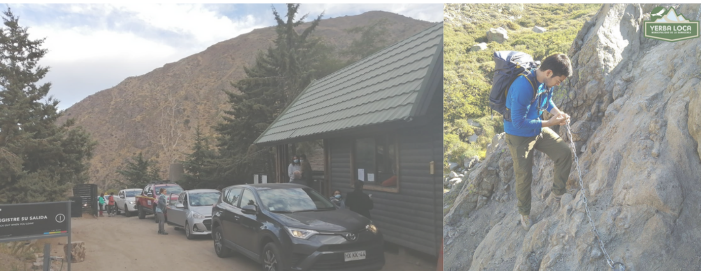
Figura 9. Fotografía de la recepción del parque Yerba Loca y registro de la rondas de vigilancia de los guardaparques

Estos protocolos son fundamentales para asegurar la seguridad, el orden y la calidad de la experiencia de los visitantes en el Parque Yerba Loca, garantizando al mismo tiempo la preservación y conservación de este importante espacio natural.