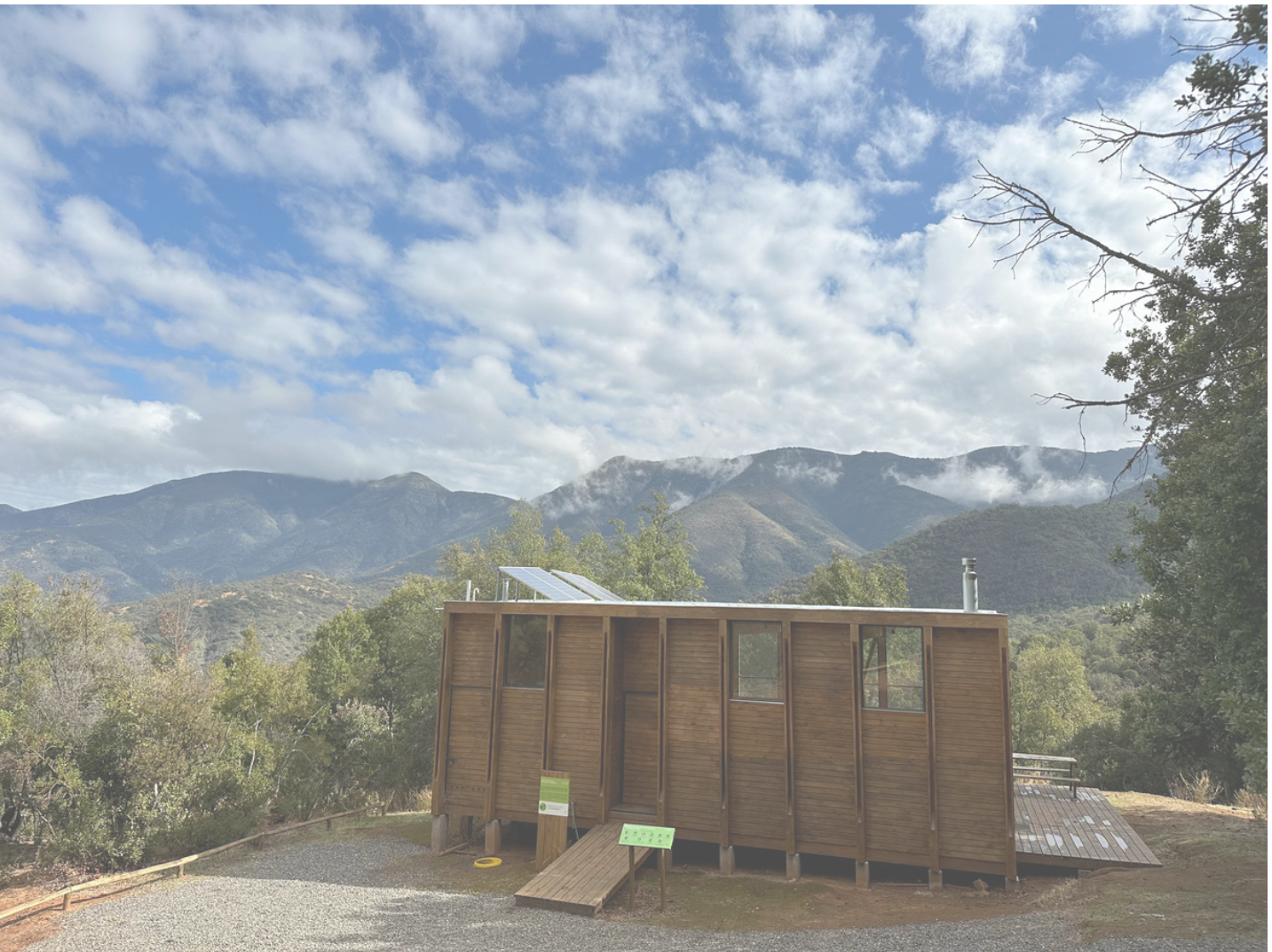
Figura 1. Fotografía del Centro de Educación e Investigación Ambiental (CEIA) del Santuario San Juan de Piche

El Santuario de la Naturaleza San Juan de Piche es un área protegida de alto valor biológico, cultural y social, cuya biodiversidad se conserva debido al compromiso y la participación de la comunidad a través de la educación, investigación y gestión de las amenazas. Ubicado en la comuna de Alhué, provincia de Melipilla, este Santuario es administrado por la Corporación Robles de Cantillana.