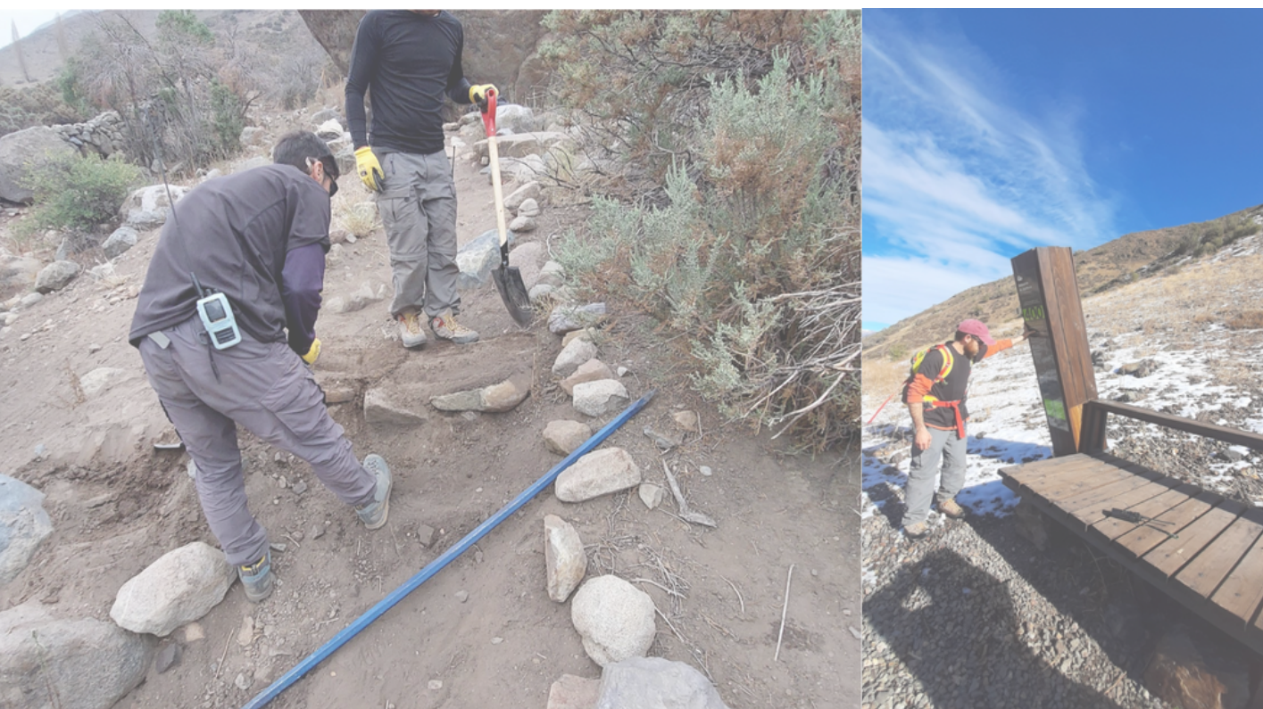
Figura 10. Fotografías de la mantención de senderos en Yerba Loca

Estas acciones de mantención, infraestructura y senderos son fundamentales para preservar la calidad y seguridad del Parque Yerba Loca, brindando a los visitantes un entorno natural bien conservado y con todas las comodidades necesarias para disfrutar de su visita.