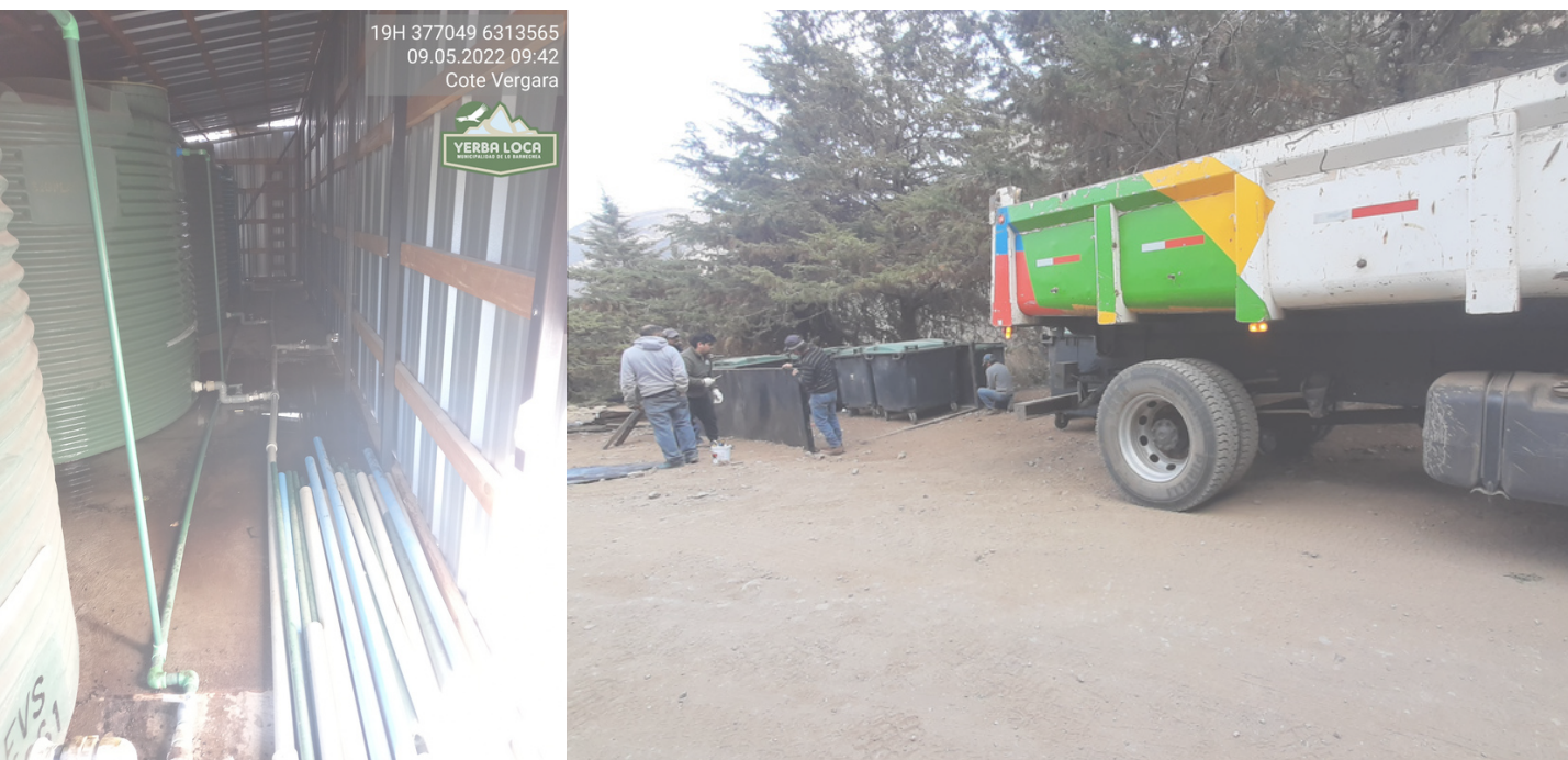
Figura 11. Fotografías de la revisión de estanques y del retiro de los contenedores de basura de Yerba Loca

En general, este enfoque de sustentabilidad busca minimizar el impacto ambiental del Parque Yerba Loca, promoviendo prácticas de gestión responsable y fomentando la participación activa de los visitantes en la protección y conservación del entorno natural.