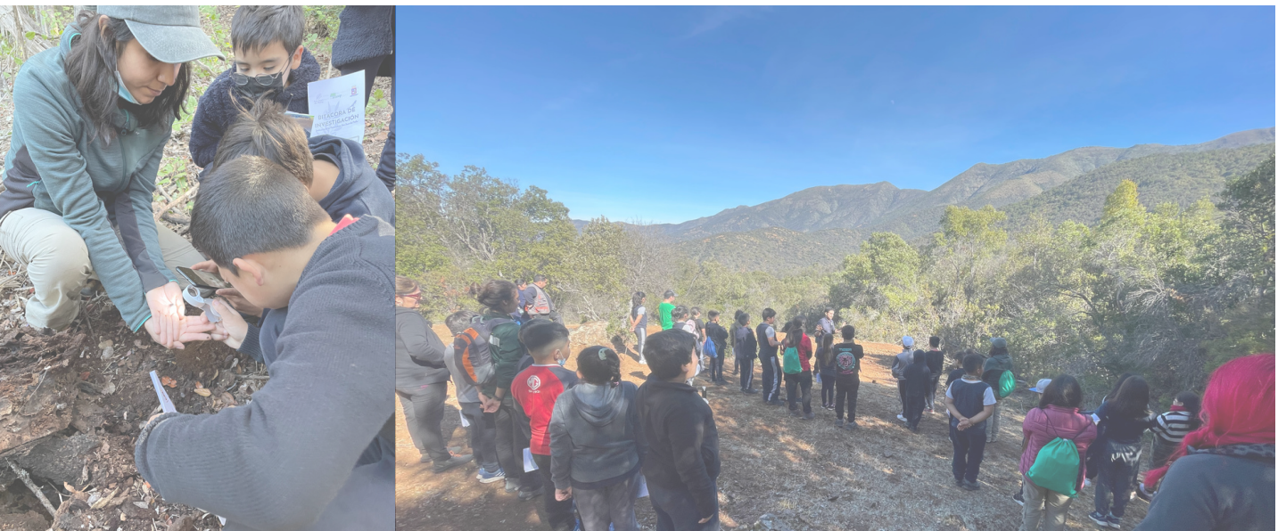
Figura 2. Fotografías de la visita en terreno del Liceo Sara Troncoso en mayo de 2023

Además, se han llevado a cabo otras instancias de educación ambiental en colaboración con EXPLORA Región Metropolitana Sur Poniente, perteneciente a la división de Ciencia y Sociedad del Ministerio de Ciencias. Además, dentro del marco del Festival de las Ciencias, se contó con la colaboración de la Municipalidad de Alhué para llevar a cabo actividades en terreno con estudiantes de la comuna de Alhué y San Pedro.