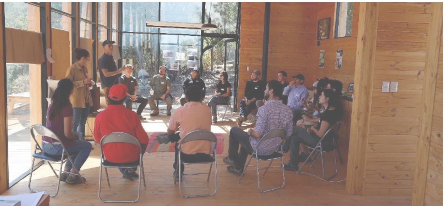
Figura 3. Fotografía del cuarto taller para la elaboración del Plan de Manejo en el CEIA

Es importante destacar que este trabajo permitirá alcanzar un hito en la conservación del país, ya que combinará dos instrumentos de conservación diferentes (Santuario y DRC) dentro de una superficie protegida, la cual se regirá por un único plan de manejo. De esta manera, la Corporación Robles de Cantillana, como una organización sin fines de lucro, con el apoyo de Tepual Conservación, se posiciona a la vanguardia de la preservación del patrimonio ambiental. Esto reafirma su papel innovador y el significativo aporte que el sector privado puede hacer para lograr las metas estatales de protección de especies y ecosistemas.