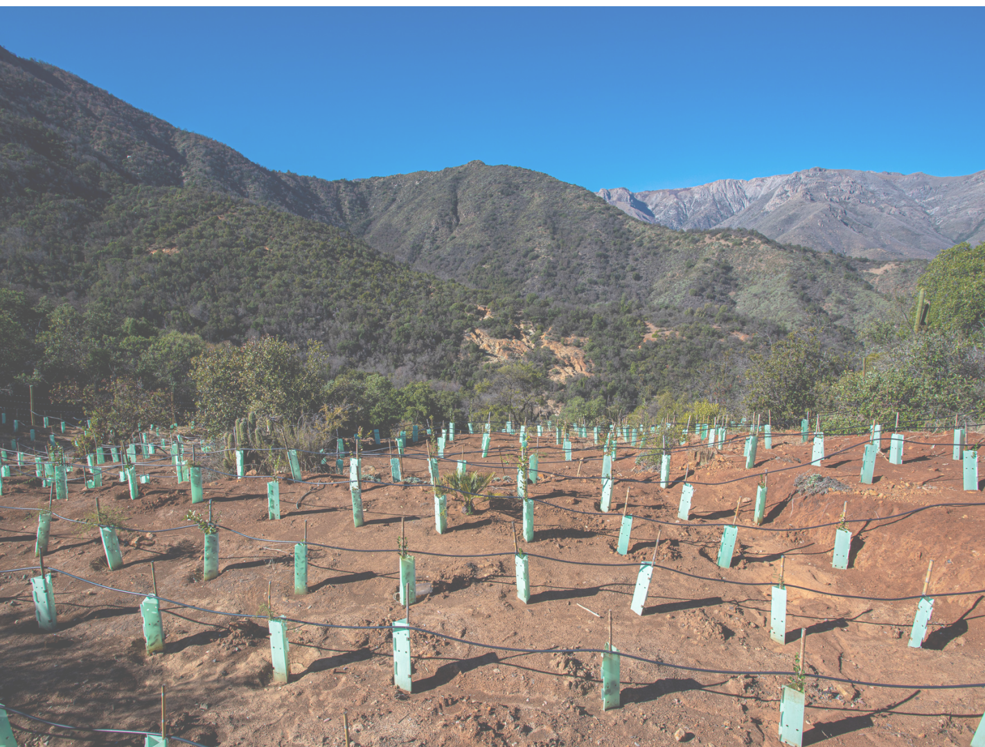
Figura 5. Fotografía de las zonas de reforestación comprometidas en los PCE en el Santuario de la Naturaleza San Juan de Piche

Las actividades desarrolladas en el Santuario de la Naturaleza San Juan de Piche son principalmente financiadas a través de la implementación de planes de compensación (PCE), los cuales se llevan a cabo mediante reforestaciones dentro del propio santuario, cuya superficie suma 200 hectáreas a la fecha. Estos planes de compensación, aprobados por la Secretaría Regional Ministerial (SEREMI) del Medio Ambiente de la Región Metropolitana de Santiago (RMS) y fiscalizados por la Superintendencia del Medio Ambiente (SMA), permiten reducir o ceder emisiones atmosféricas mediante la plantación de árboles y la restauración de áreas degradadas en el santuario. Estas acciones contribuyen directamente a la conservación de la biodiversidad y al mejoramiento del ecosistema, promoviendo la mitigación del cambio climático y la protección del medio ambiente.