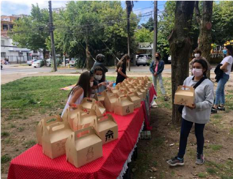
PREPARANDO LA MESA, CON LAS CAJAS QUE SE ENTREGARON A LAS FAMILIAS EN LA NAVIDAD 2021, EN EL PARQUE ECUADOR