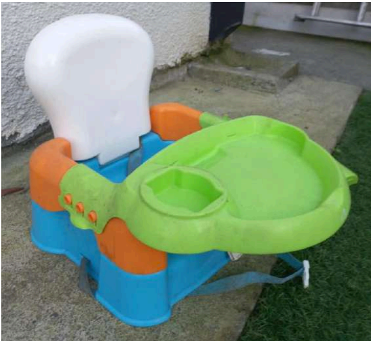
SILLITA DE COMER REGALADA A MAMÁ (SIEMPRE ESTÁN RECOLECTÁNDOSE DISTINTOS ACCESORIOS DE APOYO PARA LAS MAMITAS Y SUS BEBÉS, COMO CUNAS, SILLAS NIDOS, SILLAS DE COMER, MOCHILAS, ETC.....; ASIGNÁNDOSE ÉSTOS SEGÚN LAS NECESIDADES DE CADA UNA)