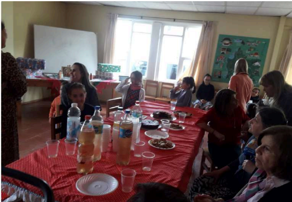
FIESTA DE NAVIDAD 2019 EN SALÓN FACILITADO POR PARROQUIA