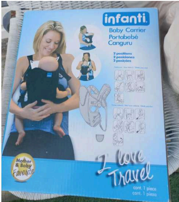
OTRO EJEMPLO DE ACCESORIO RECOLECTADO QUE SE DONÓ A UNA MAMÁ.