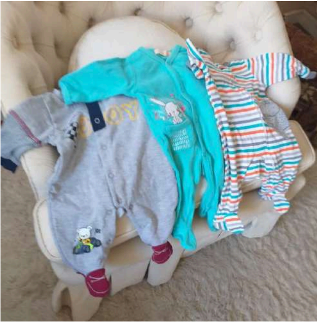
MUESTRA DE PARTE DE LA ROPITA QUE SE INCLUYE EN AJUAR