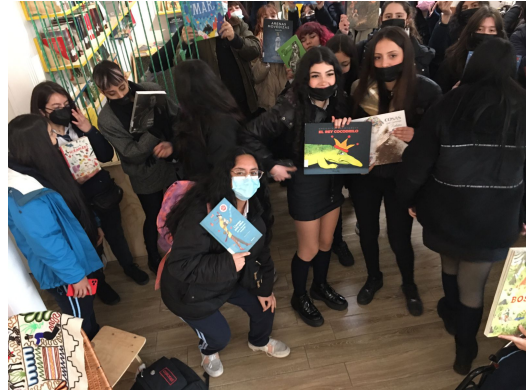
Liceo 7, Providencia