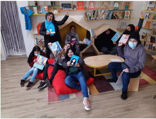
Escuela Básica D88