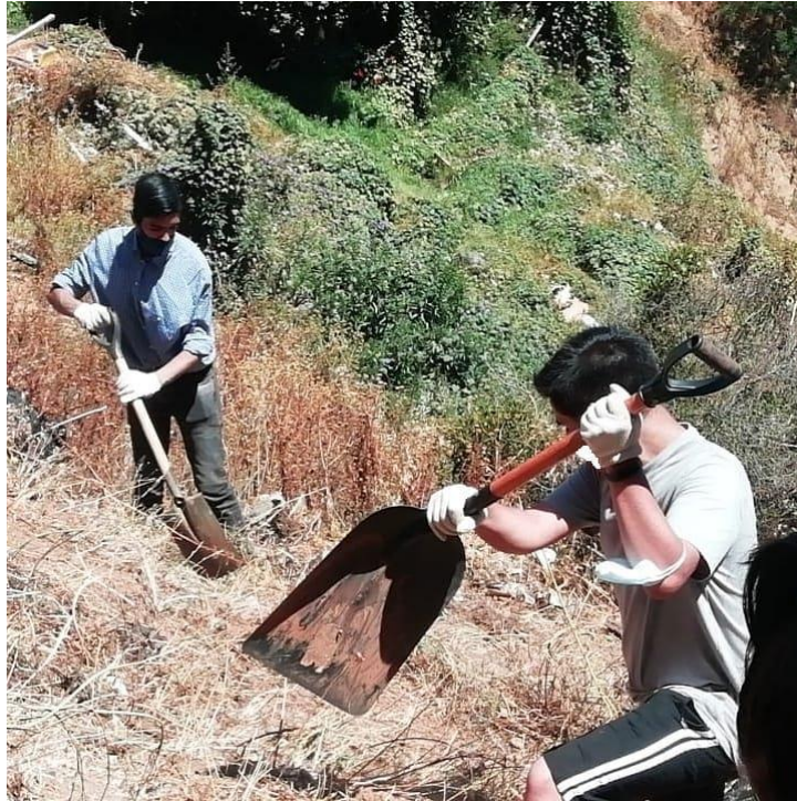
Imagen N° 1: Operativos de limpieza de lugares de alto riesgo de incendios, en sector de Forestal Alto, Viña del Mar. Marzo de 2022.