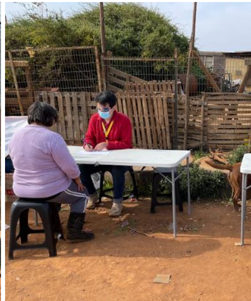
Imagen N° 2: Operativo de orientación jurídica gratuita en Campamento Felipe Camiroaga, Comité Esperanza Las Palmas N° 4, Viña del Mar. Abril de 2022.