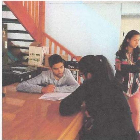
Imagen N° 3: Operativo de levantamiento de información para el desarrollo de políticas sociales en Campamento Manuel Bustos, Comité Villa La Pradera, Viña del Mar. Junio de 2022.

Finalmente, nos es necesario aclarar que, la Corporación para el Desarrollo Popular y su equipo pretenden hacer posible un sueño: construir un Chile de personas, acompañado de esos estilos que entregan soluciones y no conflictos, cenrtrándonos en el quehacer diario, en las preocupaciones reales, en el trabajo en terreno, con un ánimo de generosidad, sin ambiciones, de servicio a una causa, a fin de hacer cambios profundos, de fortaleza moral y calidad humana, para así hacer brotar del esfuerzo y trabajo de jóvenes y pobladores los mas bellos sentimientos que den paso a frutos que acaso nunca soñamos, desarrollando en forma efectiva y permanente actividades de promoción de intereses comunitarios y, programas de acción social en beneficio de los sectores de mayor necesidad, siendo, entonces, una entidad de beneficio público, que ofrece sus servicios o actividades a toda la población o a un grupo de personas de características generales y uniformes, sin que exista en la determinación de dicho grupo cualquier forma, manifestación o acto de discriminación arbitrario que vaya en contra del principio de universalidad y el bienestar común.