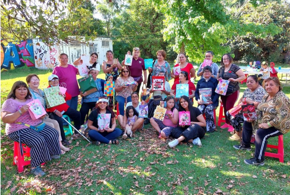
Actividad en Parcela - Sector El Castillo, Comuna de La Pintana